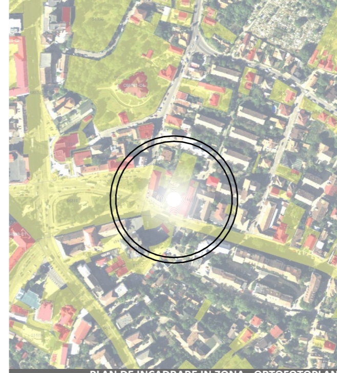
PLAN DE INCADRARE IN ZONA - ORTOFOTOPLAN SCARA 1:5000

CATEGORIA DE IMPORTANTA A CONSTRUCTIEI: "C" CLASA DE IMPORTANTA A CONSTRUCTIEI: III GRAD DE REZISTENTA LA FOC: II ZONA SEISMICA DE CALCUL "F", T c =0.7 s, a g =0.10g;